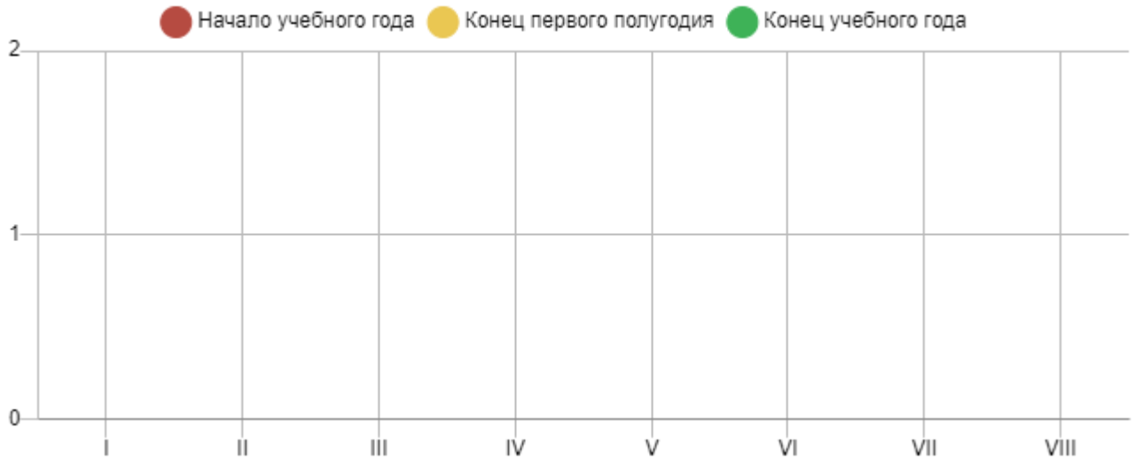
Сводная таблица уровня сформированности речевого развития за учебный год